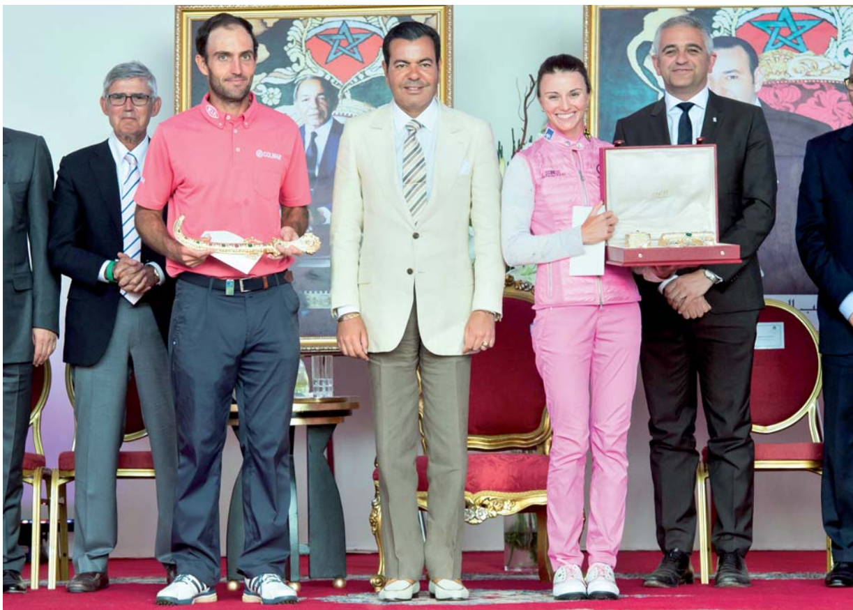
شقيق العاهل المغربي، الأمير مولاي رشيد خلال تكريم الفائزين بالدورة الـ44 لجائزة الملك الحسن الثاني للفولف الأحد الماضي

وقبل ذلك بثلاث سنوات أمر الرئيس التركماني بحظر بيع السجائر في المتاجر الرسمية خلال شهر أبريل من كل عام.